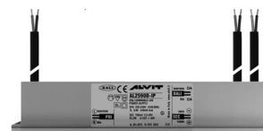
FUENTE DE ALIMENTACIÓN DIMMERABLE

Fuente de alimentación 220/240 50/60 Hz 24 V 24 W IP67 DALI