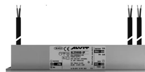
FUENTE DE ALIMENTACIÓN DIMMERABLE

Fuente de alimentación 220/240 50/60 Hz 24 V 24 W IP67 DALI