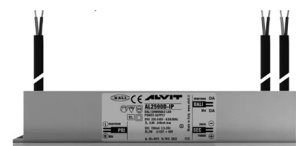
FUENTE DE ALIMENTACIÓN DIMMERABLE

Fuente de alimentación 220/240 50/60 Hz 24 V 24 W IP67 DALI