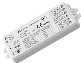
UNIDAD DE CONTROL RGBW

Unidad de control WT5 RGBW PWM/WiFi de 5 canales