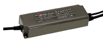
FUENTE DE ALIMENTACIÓN DIMMERABLE