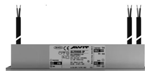
FUENTE DE ALIMENTACIÓN DIMMERABLE

Fuente de alimentación 220/240 50/60 Hz 24 V 24 W IP67 DALI