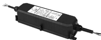
FUENTE DE ALIMENTACIÓN NO DIMMERABLE

Fuente de alimentación CC 24 V 150 W 6,25 A IP67