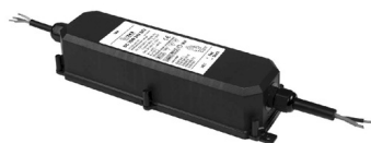
FUENTE DE ALIMENTACIÓN NO DIMMERABLE

Fuente de alimentación CC 24 V 70 W 2,9 A IP67