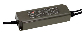
FUENTE DE ALIMENTACIÓN DIMMERABLE

Fuente de alimentación CC 24 V 120 W 5 A IP67 DALI2/PWM