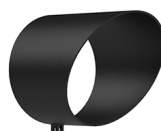
VISERA FLUMEN 3.0