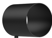
SNOOT FLUMEN 3.0