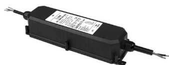
FUENTE DE ALIMENTACIÓN NO DIMMERABLE

Fuente de alimentación CC 24 V 70 W 2,9 A IP67