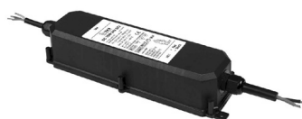
FUENTE DE ALIMENTACIÓN NO DIMMERABLE

Fuente de alimentación CC 24 V 150 W 6,25 A IP67