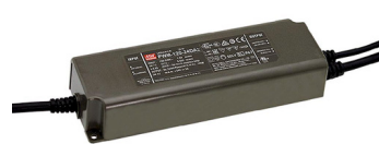
FUENTE DE ALIMENTACIÓN DIMMERABLE

Fuente de alimentación CC 24 V 120 W 5 A IP67 DALI2/PWM