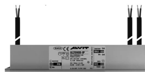
Fuente de alimentación 220/240 50/60 Hz 24 V 24 W IP67 DALI Cod: MID0021