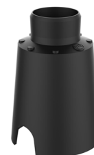
MOSTRADOR DE DRENAJE Caja empotrada en suelo con drenaje VITRUM 2 Cod: VITZZZ001