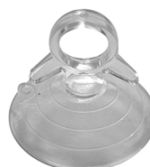
Anillo para empotrar en el yeso VITRUM 2 Cod: VITZZZ007