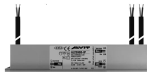
ALIMENTATORE DIMMERABILE Alimentatore 220/240 50/60Hz 24V 24W IP67 DALI