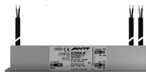
ALIMENTATORE DIMMERABILE Alimentatore 220/240 50/60Hz 24V 24W IP67 DALI