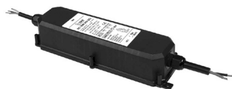
ALIMENTATORE NON DIMMERABILE