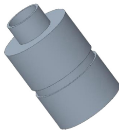
CONTROCASSA DRENANTE SLIM Controcassa drenante slim OCEANO 2