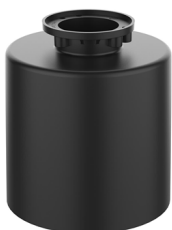
CONTROCASSA CARRABILE Controcassa carrabile OCEANO 3