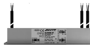
ALIMENTATORE DIMMERABILE Alimentatore 220/240 50/60Hz 24V 24W IP67 DALI