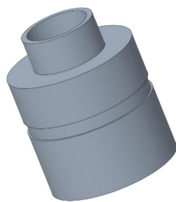
CONTROCASSA DRENANTE SLIM