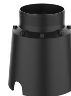
CONTROCASSA DRENANTE Controcassa drenante VITRUM 3 Cod: VITZZ002