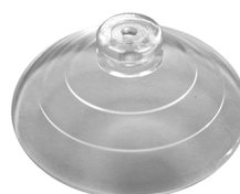
KIT ESTRAZIONE Ventosa per VITRUM 3 Cod: VITZZ011